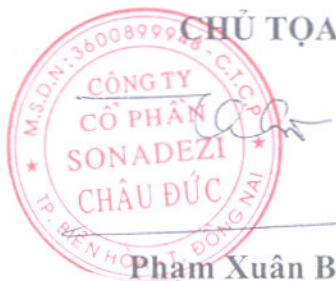
Phạm Xuân Bách

Chủ tọa và Thư ký cùng ký tên vào Biên bản họp.